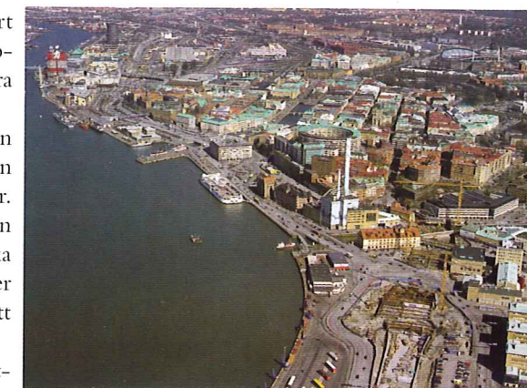
Södra Älvstranden står inför en omvandling.

byggas ut och en park ska sträcka sig bort mot Nordstan.